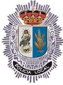
Policía Local Ajalvir