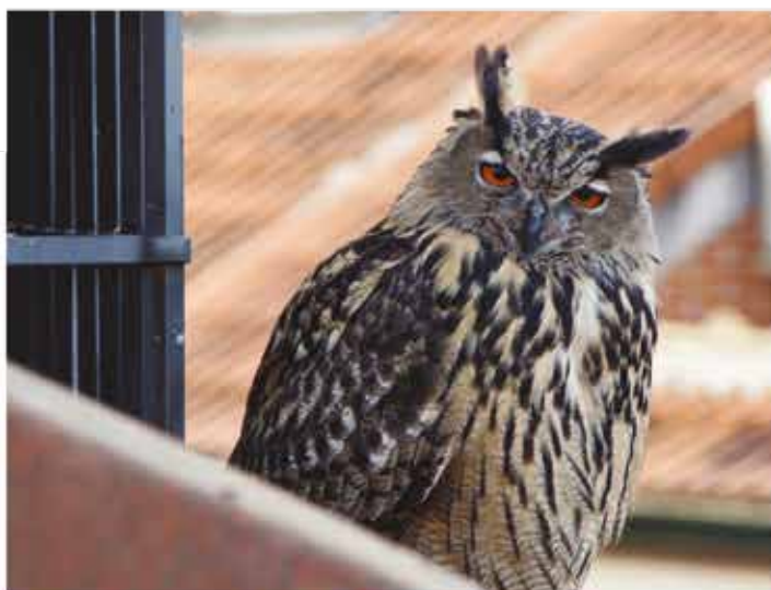
Mirada de un Buho Real. Feli Gallego Minguez